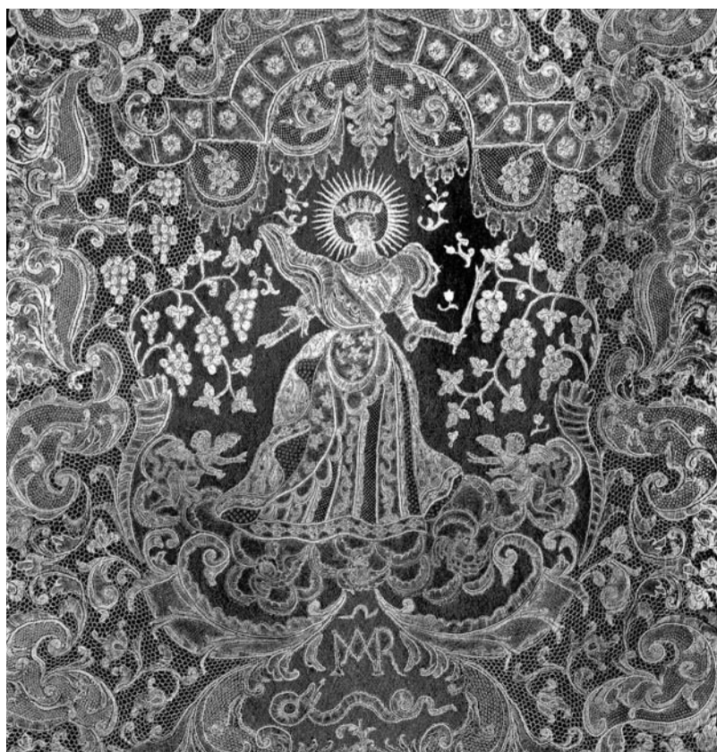
VIERGE VICTORIEUSE DU SERPENT, DENTELLE AU FUSEAU DE BRUXELLES, 1701