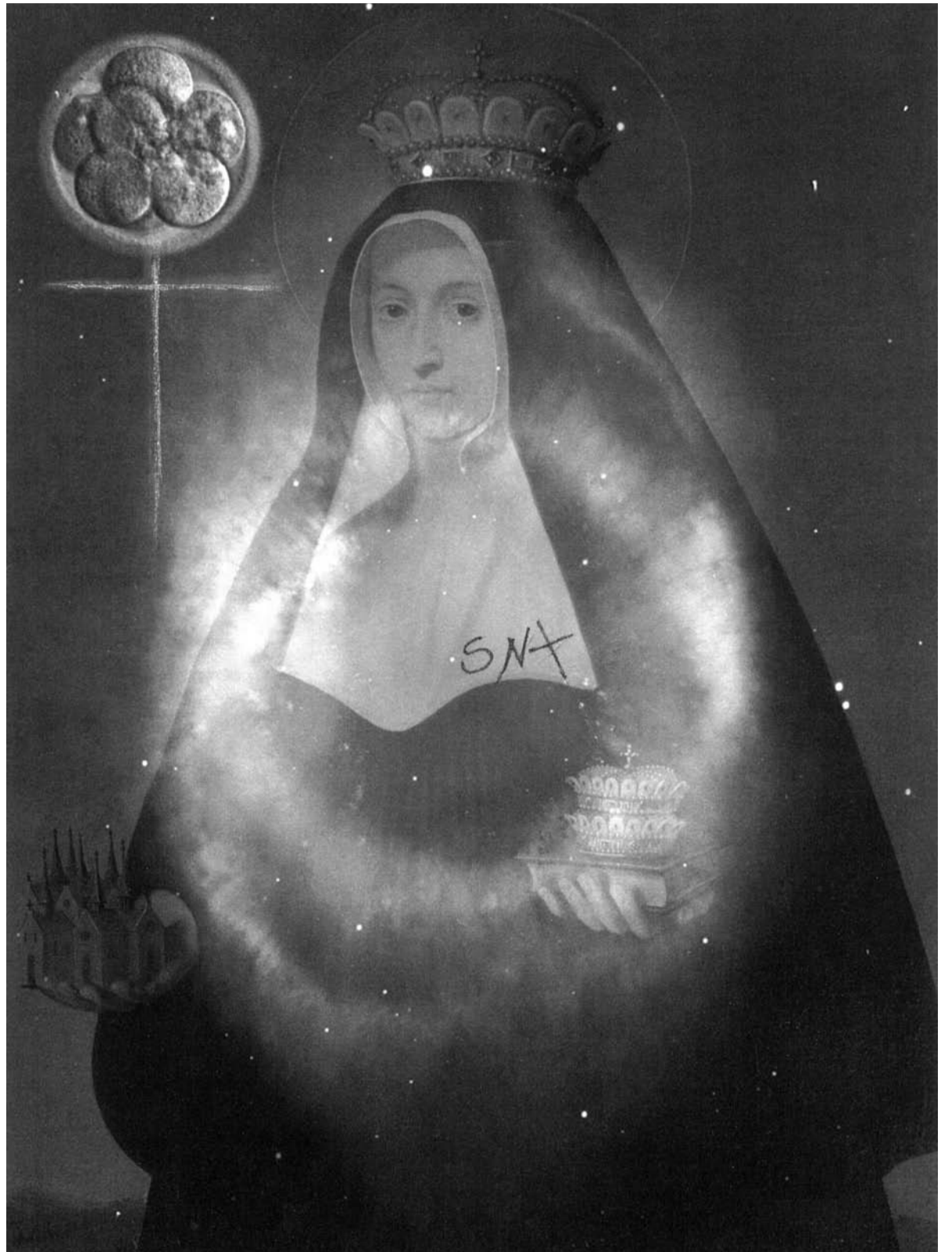
DOMINIQUE VERMEESCH, SANS TITRE, TECHNIQUE MIXTE, 2015