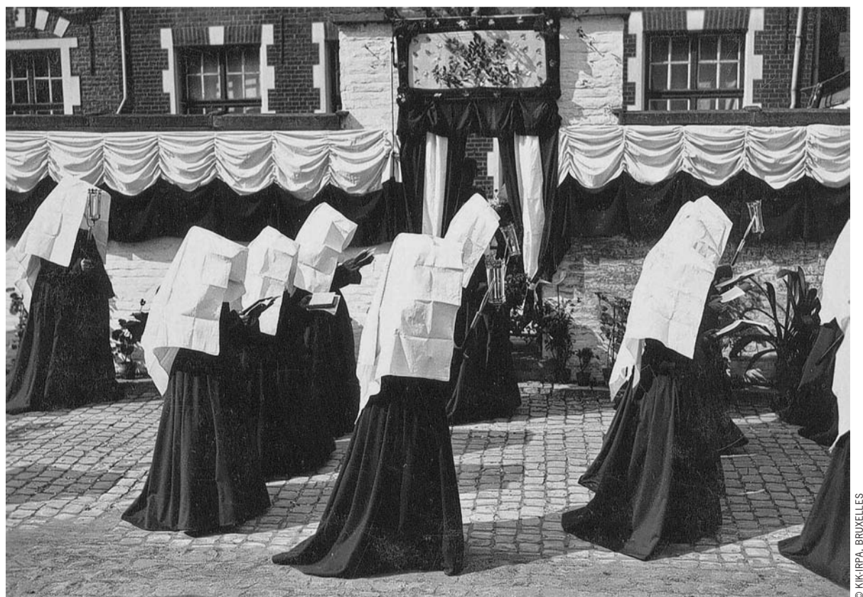
PROCESSION DE BÉGUINES, BRUXELLES, 1941